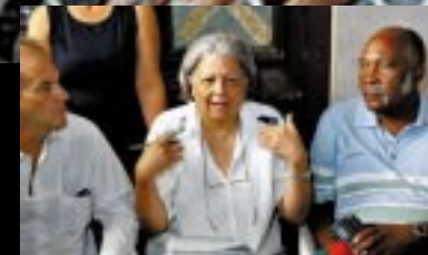
L'APSC, Asamblea per Promuovere la Società Civile, ha convocato una riunione nazionale per definire una comune piattaforma con altri movimenti semiclandestini come "Tutti Uniti" e il "Movimento Cristiano di Liberazione".