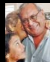
Grazie alle pressioni internazionali è libero Raul Rivero è tornato in libertà, per ragioni di salute, il più conosciuto dei 75 dissidenti cubani condannati a pene detentive tra i 18 ed i 27 anni di carcere per reati d'opinione.