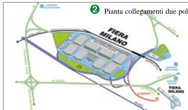
2 Pianta collegamenti due poli