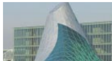
Pinnacolo in costruzione

piano. Tutti i padiglioni si distinguono per le dimensioni e la flessibilità di utilizzo. Ognuno di essi misura infatti circa 37mila metri quadrati, è autonomo in quanto dotato di proprie reception, punti di ristorazione, sale convegno, aree per uffici e può