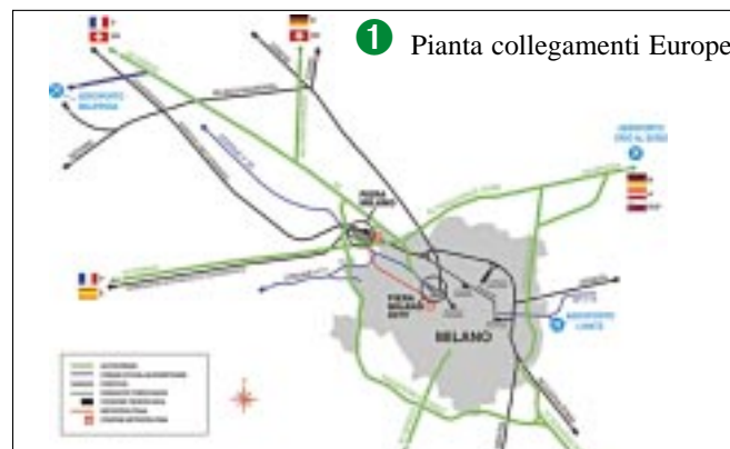
1 Pianta collegamenti Europei

Uffici di mostra - Gli uffici delle segreterie di mostra sono ospitati in quattro edifici in vetro e acciaio disposti lungo il viale centrale. Show room - Lungo il viale centrale sono collocati 8 show room.