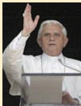
Sua Santità Papa Benedetto XVI