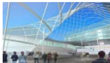
Interno della Vela

La circolazione dei mezzi in prossimità e all'interno del complesso è distribuita su tre anelli: il primo, dedicato alla "viabilità di avvicinamento", interessa sia gli utenti fiera sia il traffico generico; il secondo è