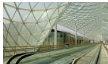
La vela - Tapis roulant

piano. Tutti i padiglioni si distinguono per le dimensioni e la flessibilità di utilizzo. Ognuno di essi misura infatti circa 37mila metri quadrati, è autonomo in quanto dotato di proprie reception, punti di ristorazione, sale convegno, aree per uffici e può